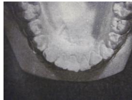
Exemple modéré :

Le résultat à long terme est un chevauchement qui peut devenir très important.