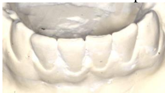
1 an plus tard :

Ceci touche 80% des adultes. Il peut parfois être très rapide!