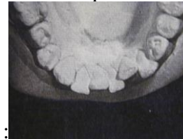
15 ans plus tard :

Ceci touche 80% des adultes. Il peut parfois être très rapide!